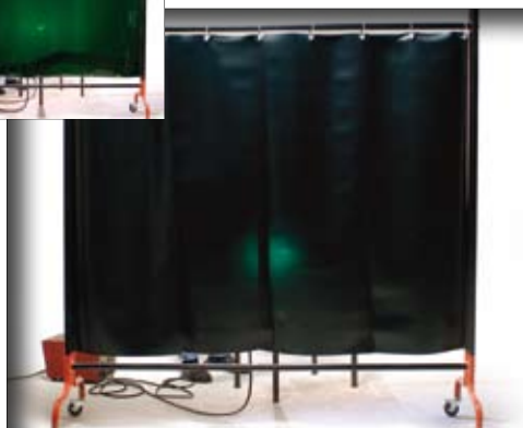
Rideau soudure vert foncé à lanières sur support SUPAN 2.