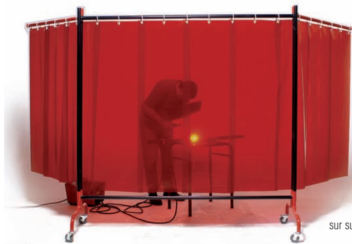
Rideau soudure rouge orangé sur support "SUPAN 4"