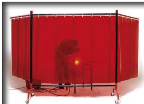
Rideau soudure rouge orangé sur support SUPAN 4.