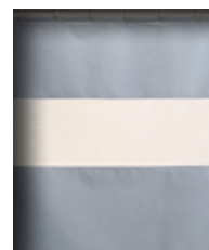
Rideau à bande de vision NV 617 + SV 410