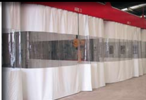
Rideaux avec bande de vision.