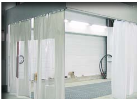
Rideaux à fenêtre.