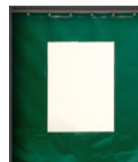
Rideau à fenêtre NV 616 + SVA 316