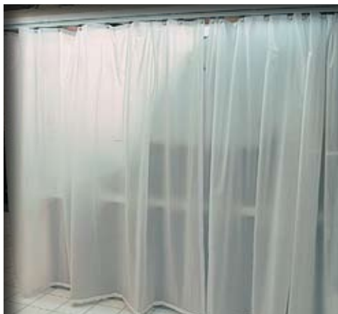
Rideaux en film SM1 328.

Délimitent les volumes à chauffer. Créent des espaces intermédiaires. Séparent des postes de travail. Protègent des courants d'air.