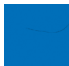
CH/NV 407 bleu

Réalisation sur mesure avec bordure renforcée, œilletée tous les 50 cm. Fixation par sandow périphérique fourni. Prévoir un débord mini. de 25 cm sur la margelle.